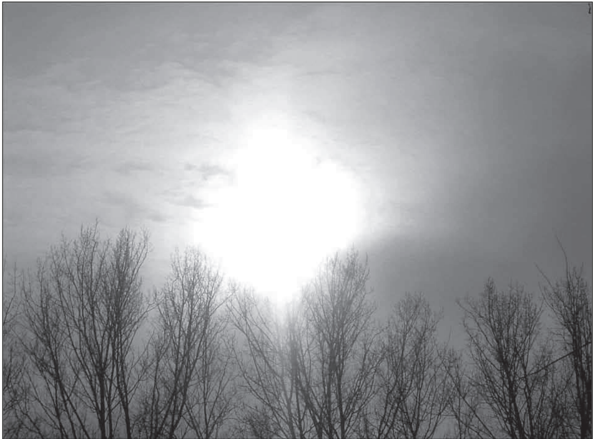
Figuur 2: Foto van een deelnemer rond het thema heden met als onderschrift: 'Vroeger was werken-werken-werken. Ik heb nu tijd om interessante dingen te leren en ook uit te voeren.'

meer empowerment te verwerven. De omgeving reageert op haar beurt ook vaak positief op de deelname van de persoon aan een dergelijk project.